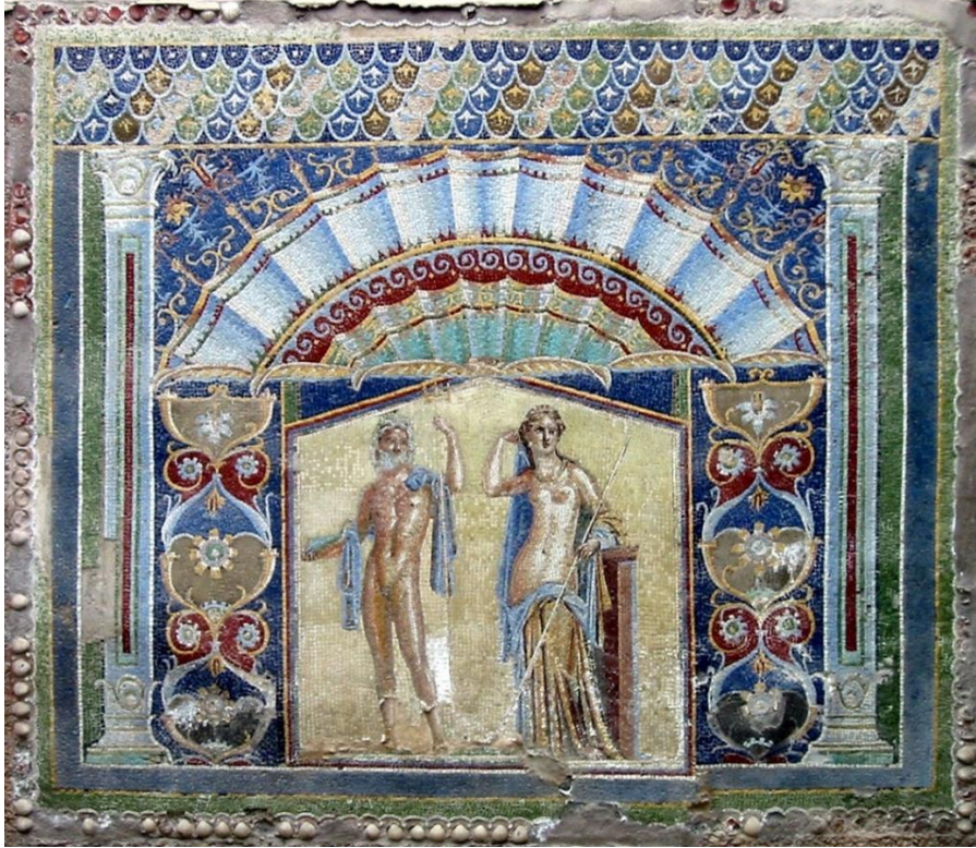
Kuva 8: Roomalainen seinämosaiikki muinaisessa Herculaneumissa