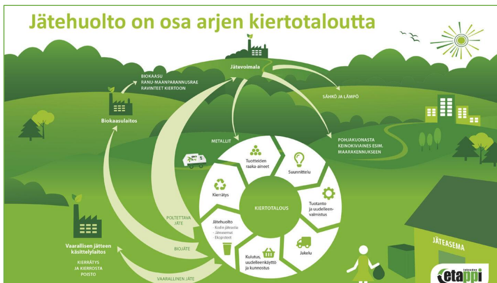
Kuva 7: Kiertotalous, Kuva: Lakeuden etappi

https://www.etappi.com/jateneuvonta/jatehierarkia-ohjaa-toimintaa/