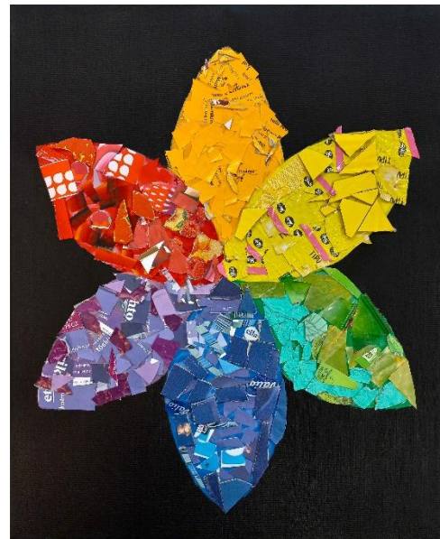
Kuva 6: Tiede ja taide -hankkeen toinen mosaiikkiteos.

Yhteisen mosaiikin voi täyttää esimerkiksi niin, että ohjaaja levittää liimaa taustaan ja oppijat kiinnittävät leikkaamansa oikean väriset palaset taustaan kiinni.