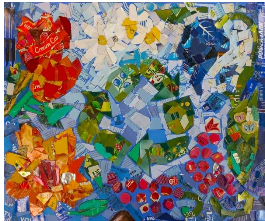
Kuvat 4 ja 5: Tiede ja taide -hankkeen ensimmäisen yhteisen mosaiikkiteoksen pohja ja valmis teos.

Yhteisen teoksen kuvio kannattaa suunnitella riittävän yksinkertaiseksi. Tiede ja taide -hankkeessa suunniteltu ensimmäinen pohja osoittautui turhan yksityiskohtaiseksi ikäluokalle (kuvat 4 ja 5). Ohjaaja sai tehdä viimeistelyn, jotta kuvasta tuli selkeää. Toinen pohja oli taas työpajan ikäluokan nuorimmille sopiva ja vanhemmille ehkä hieman turhan yksinkertainen (kuva 6).