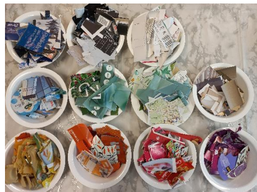
Kuva 1: Kierrätysmateriaalit lajiteltuina värin mukaan

Kierrätysmateriaalit voi halutessaan leikata valmiiksi värien mukaisesti suurempina paloina omiin kippoihin, näin tarvittavan värin etsiminen sujuu helpommin.