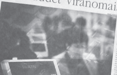
Tietotekniikka on mahdollistanut ja tehostanut monien mahdollisuuksien osittain osittain laajaa toimintatapa- ja prosessien uudistamista. Kuvassa nähdään julkaisun verkkosivua.