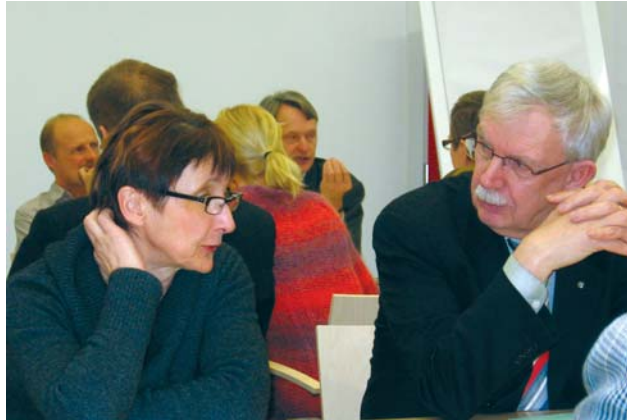
Jokioisten workshopissa ideat lensivät.

toimijoiden osallistaminen ovat keskeisessä roolissa kiertueella.