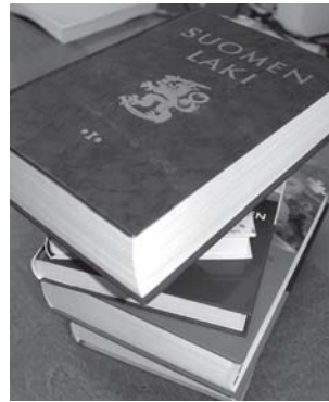
Kandidaatin tutkintoon tähtäävät talousoikeuden opinnot on mahdollista suorittaa työn ohessa noin kolmessa vuodessa.

- Talousoikeudessa yhdistyy juridinen ja liiketaloudellinen osaaminen. Laki- tai veroekonomiksi valmistunut voi työllistyä niin julkishallintoon kuin yritysten yleisjohtoon ja asiantuntijatehtäviin.