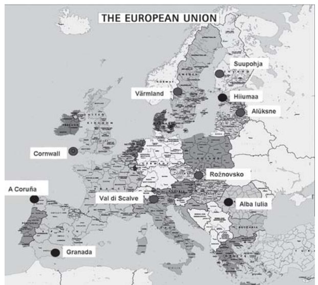
ASPIRE-hankkeen kestävä energiahuollon pilottialueet.

muassa Suupohjan kuntien tekniset johtajat, energiayhtiöiden ja muiden alan toimijoiden sekä rahoittajien edustajia. Oleellista onkin, että alueen keskeiset toimijat ovat kehittämiseen