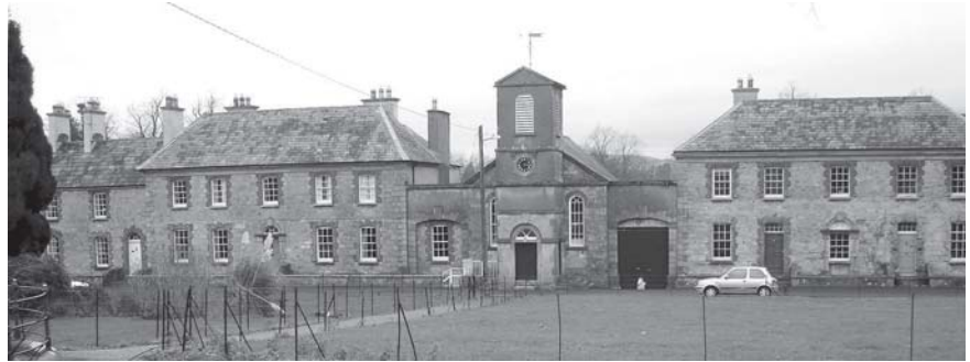
European Network of Local Development kokoontui tänä keväänä Irlannissa. Syksyllä tapaamisen isännöintivuorossa on Pohjanmaa.