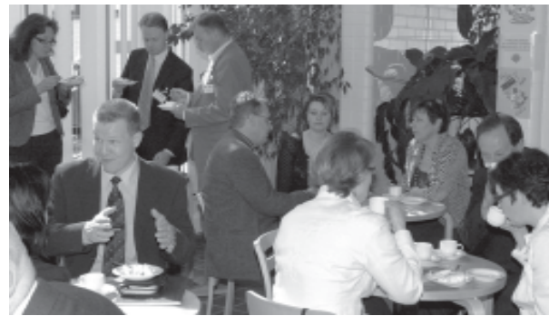
Seminaarin kahvituolla ehdittiin vaihtaa kuulumisia ja keskustella päivän annista.

hankkeen opiskelijalle motivaation lähde. Opintojen läheisyys madalsi aloituskynnystä ja tuttu opiskelijaporukka tuki ja kannusti toisiaan jatkamaan. Aikuisena opiskeleminen on kuitenkin vaativaa. Vuorokauden