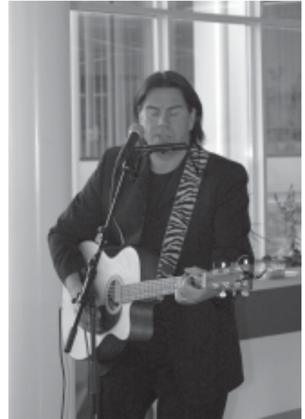
Itajuhlissa puhetta piti ja musiikkiaan esitti taiteilija Mikko Kuustonen. Hänen pääviestinsä oli: “Jos haluat kulkea nopeasti, kulje yksin, mutta jos haluat kulkea pitkälle, kulje yhdessä.”

Luovuus vaatii rikastavaa yhteisöä, joka taas edellyttää luottamusta. Käänteisesti voidaan todeta, että reilun eli avoimuuden ja oikeudenmukaisuuden kulttuuri luo työyhteisön sisäistä luottamusta. Se mahdollistaa rikastavan yhteisön, jota tukee kannustava yhdessä työskentely, avoin kritiikki ja työyhteisön jäsenten arvostus. Tällaisessa yhteisössä annettu vapaus tuo esiin ihmisten luovuuden ja mahdollistaa sekä ihmisten hyvinvoinnin että innovaatioiden ja taloudellisten tulosten syntyminen.