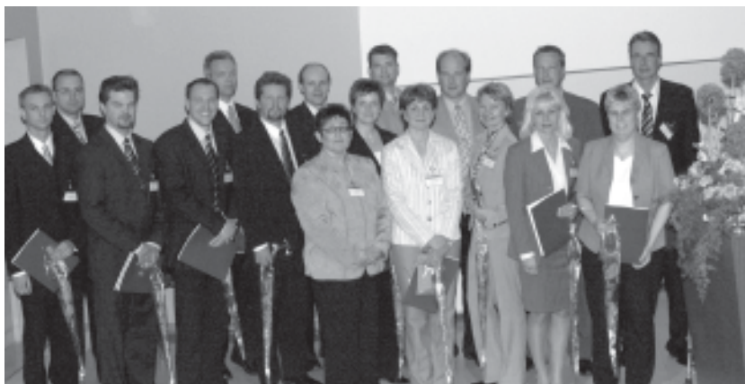
Seminaari päätettiin jakamalla todistukset ja kukat vuoden 2007 JOKA-ryhmäläisille.

Aikoinaan jo se, että KONE osti itseään suuremman yrityksen