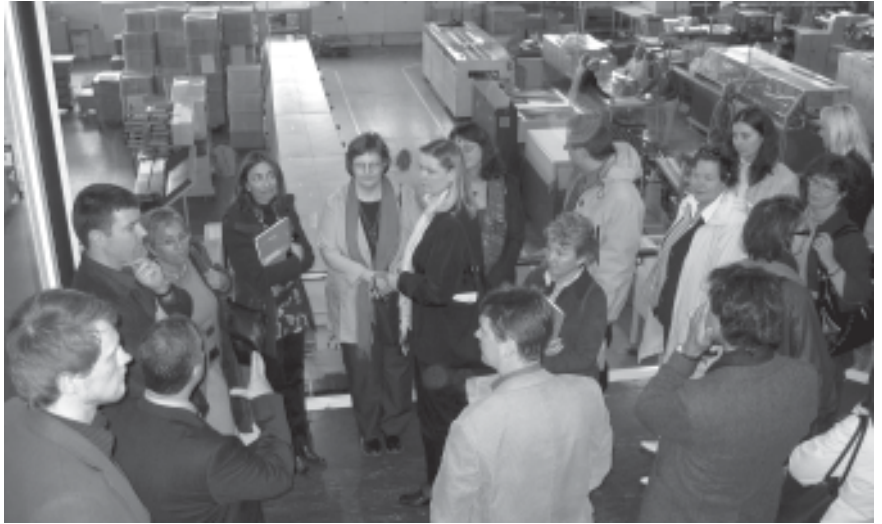
Trias-keksien valmistusta pääsimme katsomaan ainoastaan lasiseinän läpi.

Levón-instituutin hallinnoiman Spirit-hankkeen espanjalainen partneri järjesti maaliskuussa yhteinen La Selvan alueella Espanjan Kataloniassa, noin sata kilometriä Barcelonasta pohjoiseen. Matkalla mukana oli hankkeemme toimijoita ja ohjausryhmän jäseniä.