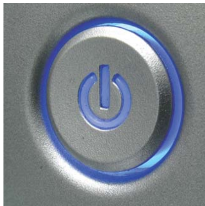
Stand-by-tila kuluttaa usein paljon energiaa.

Konkreettisesti oppilaat laskivat esimerkiksi kaikkien sähkölaitteiden, lämpöpattereiden ja valaisinten määrän koulussa. Sähkölaitteiden määrä on huomasti lisääntynyt kouluissa viimeisen 20 vuoden aikana esimerkiksi tietokoneiden, televisioiden ja dokumenttikameroiden yleistymisen myötä, mikä ei voi olla näkymättä sähkönkulutuksessa.