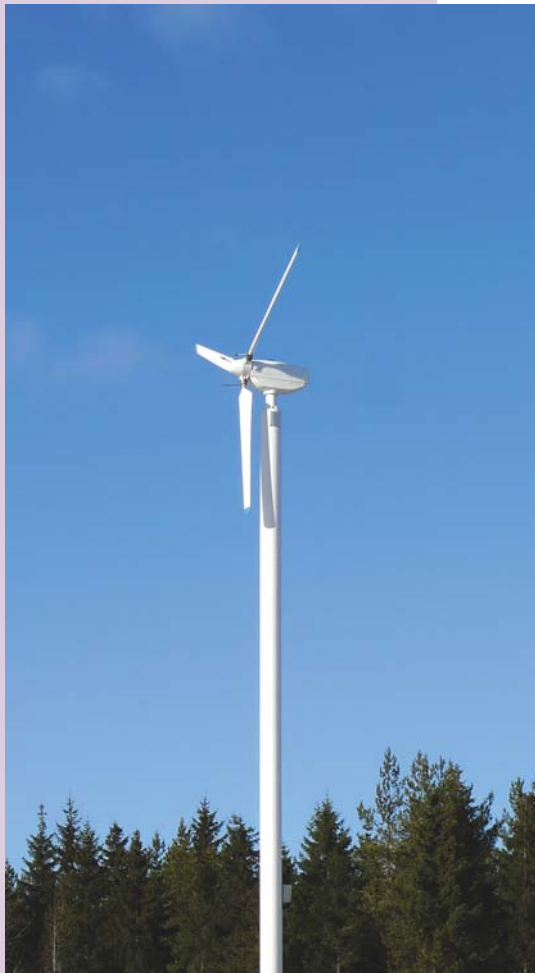
Tuulivoimalla voi olla yksi vaihtoehto, kun pohditaan kylien energiaomavaraisuutta.

Levón-instituutissa käynnistyi 2009 vuoden loppupuolella Energiakylä-niminen hanke, joka tähtää Pohjanmaan maakunnan energiaomavaraisuuden kehittämiseen erityisesti erikokoisten kylien avulla.