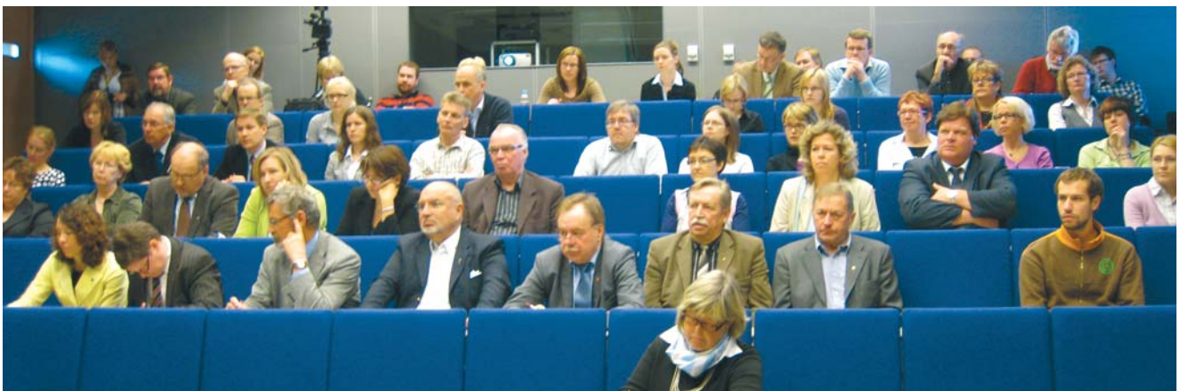
Hankkeen Vaasan fokusryhmäseminaariin oli kokoontunut paljon etenkin pohjalaisia kuntapäättäjiä.

Hanke toteutetaan 1.10.2008–30.9.2009 Vaasan yliopiston, Åbo Akademin ja Uumajan yliopiston välisenä yhteistyönä. Hankkeen koordinaattorina toimii Uumajan yliopiston kulttuurimaantieteen laitos. Lisäksi toteutukseen osallistuu paikallisia ja alueellisia toimijoita Suomesta ja Ruotsista. Vaasan yliopistossa hanke toteutuu aluetieteen oppiaineen ja Levón-instituutin yhteistyönä.