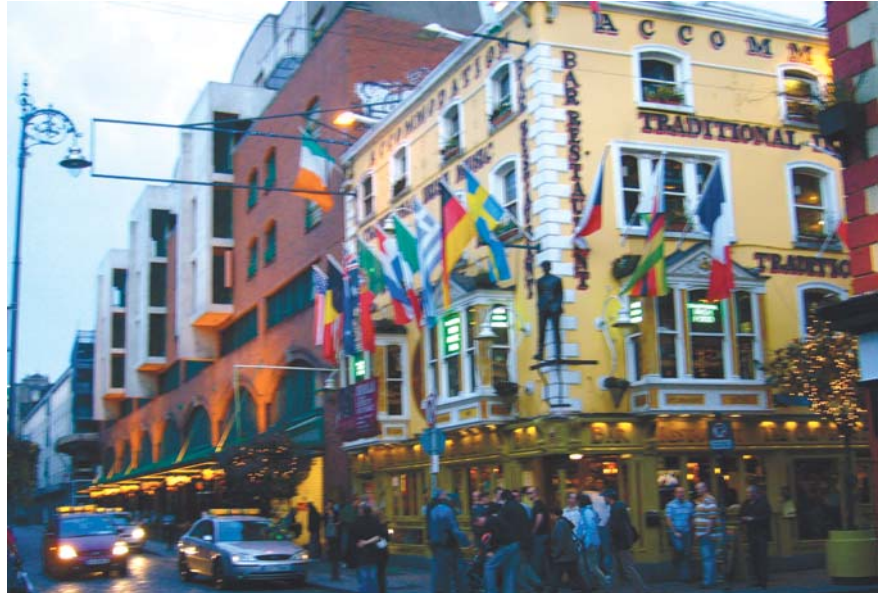
Dublinin Temple Barin alueella löytyy monenlaista tarjontaa myös vapaa-ajalle.