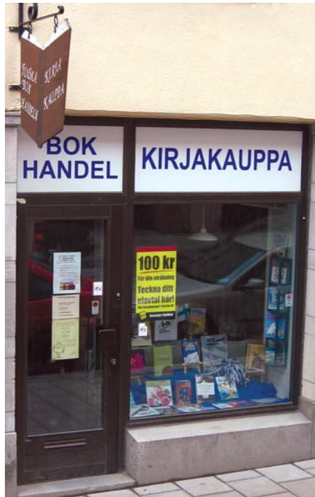
Suomenkielisten kirjakauppa Tukholmassa.

Perjantaiamuna melkeinpä kirjaimellisen laivalta ulosheittämissä jälkeen tutustuimme vahingossa melko perusteellisesti Tukholman keskustaan. Siitä pitivät huoli Tukholman kello kahdeksan ruuhka sekä täydellinen eksyminen reitiltä matkalla ensimmäiseen vierailu-