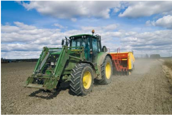
Jos ASPIRE-projekti onnistuu, tämäkin traktori saattaa tulevaisuudessa kulkea paikallisella energialla.

Hankkeen tuloksena odotetaan syntyvän kuvaus kunkin osallistujamaan yleisistä käytännöistä täden- nettyinä hankkeen aikana kehitetyillä hyvillä käytännöillä eli toimivilla yhteis-