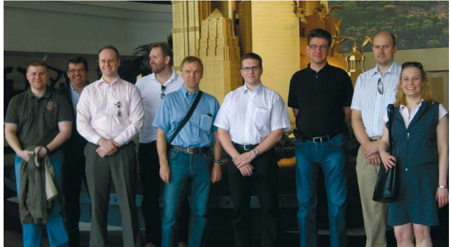
Opintomatalla Shanghaissa – virallinen ohjelma ohi ja vuorossa nähtävyyksiin tutustuminen.

JOKA-ohjelmassa opiske- lusta on pyritty luomaan varsin käytän-