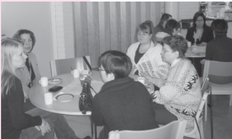
Vaasalaisia yrittäjyyskasvatuksesta kiinnostuneita kurssilaisia sulattelemassa lähipäivän aiheita kahvituolla.

Levón-instituutin järjestämässä koulutuksissa on kuluvan talven aikana tutustuttu yrittäjyyskasva-