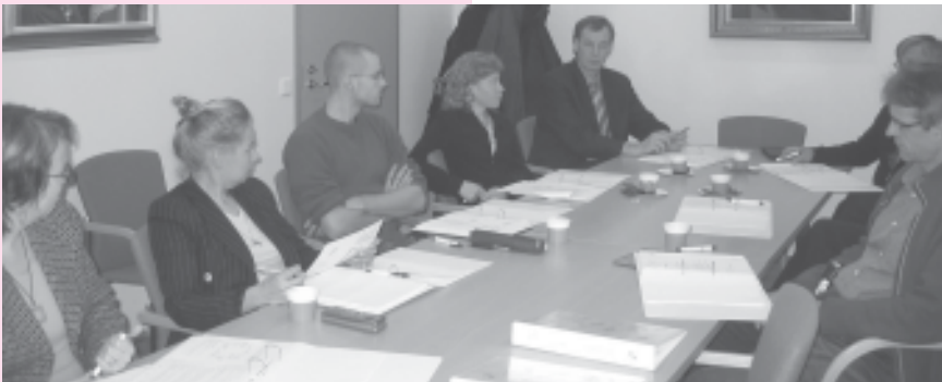
Sopimusoikeuskoulutuksen osallistujat keskittyneinä kiinnostaviin kysymyksiin loppuvuodesta 2006.

Seinäjoella huhti-toukokuussa toteutettavaan ohjelmaan voi hakeutua helmi-maaliskuun aikana. Lisätietoja ohjelmasta www.equalspirit.fi tai sähköpostitse hannu.mitts@uwasa.fi ja puhelimitse 06-324 8464.