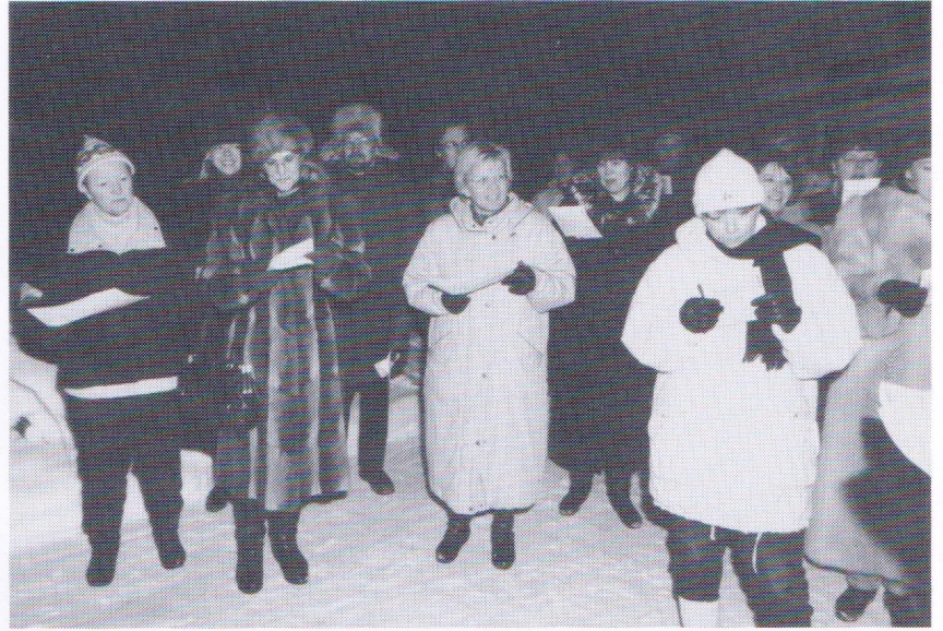
Enkelikuoron lohdullinen viesti Virtasten pihalla 4. tammikuuta 1994 klo 6.30: Vuodet on vierineet, hurmos on haihtunut, nuoruus jo mennyt on, oi!