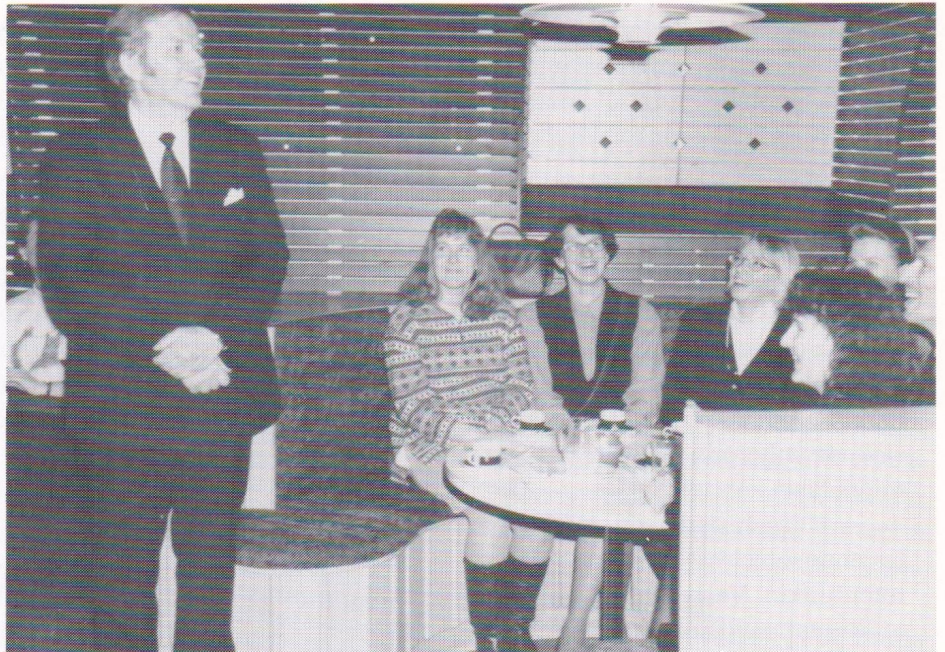
Synttärilahvittelua yliopistolaisten kanssa ylioppilaskunnan ravintolassa.

— Kuvittelin, että menen johonkin firmaan operaatioanalyttikoksi atk-osastolle. Kun aloitin gradua ja rustailin ensimmäisiä paikkahakemuksia, kauppakorkeakoululta kysyttiin, että kiinnostaisiko talousmatematiikan ja tilastotieteen assistentin paikka. Ajattelin, että voisihan si-