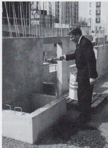
Uuden yliopistoalueen peruskiven ensimmäisenä muurarina oli pääministeri Esko Aho.