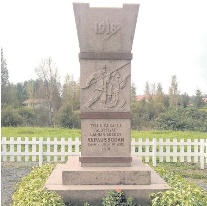
Hulmin taistelun muistomerkki

gin surma koettiin perusteettomaksi ja tehdyksi niin raatavalla tavalla, että puhuttiin yleisesti murhasta. Berg haudattiin myöhemmin Mustasaaren vapaussoturiin sankarihautaan, hänet katsottiin Vapaussodan ensimmäiseksi uhriksi.