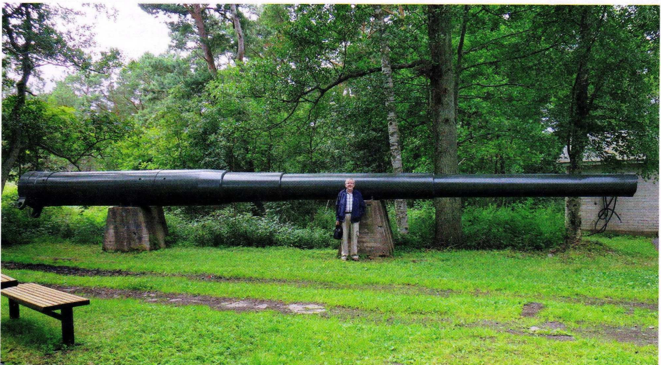
■ Obuhov-tykin vaihtoputki. Putken kaliiperi 12" (305 mm), pituus 16 m ja paino 50 tn

sesta kiinnostuneille yksityisille henkilöille. Mukaan voi huoletta ottaa koko perheen, sillä sotilaskohteista mahdollisesti vähemmän kiinnostuneillekin on pelkästään ainutlaatuisessa luonnossa yllin kyllin katsottavaa ja koettavaa. Tarjolla on myös monipuolisia majoitusvaihtoehtoja, joita hyödyntämällä saareen voi tutustua perusteellisemminkin. ■