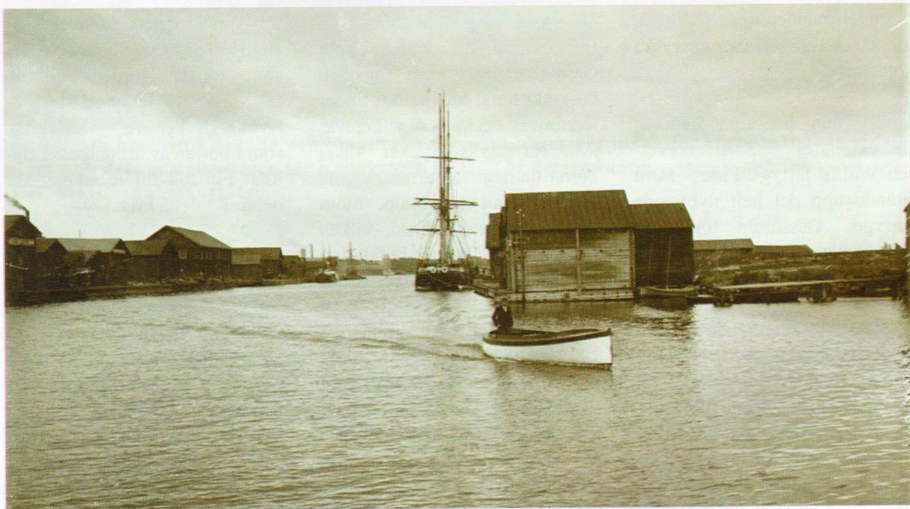
Hamnen i Brändö sedd från norr.