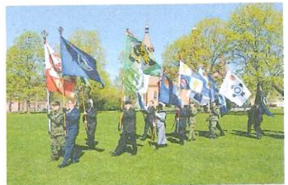
Fanborgen hedrade minnesplaketten avtäckning.

lan generationerna. Många unga jag möter i dag känner en respekt och vördnad inför de personer som var med och hjälpte till under svåra