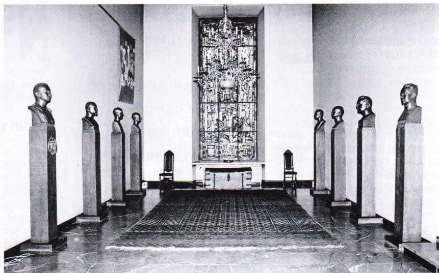
Vapaussodan muistohalli Pohjanmaan museossa.

Tiedossa ei ole, että piirros olisi johtanut vakavaan esitykseen temppelin rakentamiseksi. Se lienee toi-