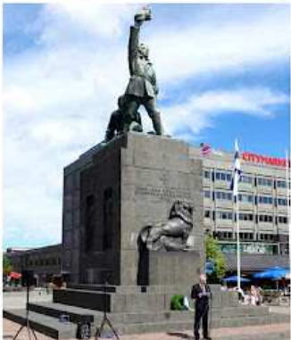
Kuva 2. Aino Nyberg kertomassa Suomen Vapaudenpatsaan symboliikasta.

Kuvassa nähdään patsaan ja 85 vuotta täyttäneen Suomen Vapaudenpatsaan palomerkki. Patsaan taustalla näkyy Vantaan taivaanranta ja Vantaan satama. Patsaan taustalla näkyy Vantaan taivaanranta ja Vantaan satama. Patsaan taustalla näkyy Vantaan taivaanranta ja Vantaan satama.