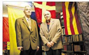
Lippu valmistettiin kaksinkertaisella leijonalla. Kukaan ei ollutkaan tiedossa, mikä lipun väri olisi.

Kukaan ei ollutkaan tiedossa, mikä lipun väri olisi. Kukaan ei ollutkaan tiedossa, mikä lipun väri olisi.