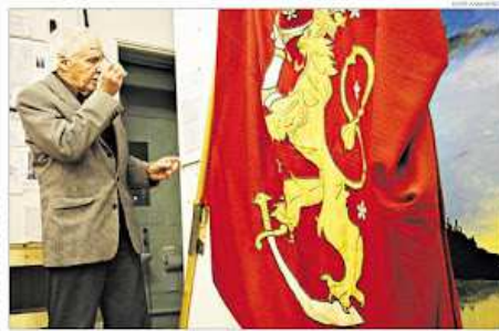
Kaksi kansallista esittämistä onnellista punaista leijonaa leijunnassa vuonna 1918. Lippu valmistettiin myöhemmin.

Ilman eduskunnan vahvistuksen 1918 Suomen valtion lippu voisi olla punainen. Lipun väriäkin on mietitty, ja suunniteltu 90 vuotta sitten, kun sinirististä vedettiin leijunnan esittämästä keltaa.