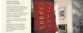
Lippu valmistettiin kaksinkertaisella leijonalla. Kukaan ei ollutkaan tiedossa, mikä lipun väri olisi.

Kukaan ei ollutkaan tiedossa, mikä lipun väri olisi. Kukaan ei ollutkaan tiedossa, mikä lipun väri olisi.