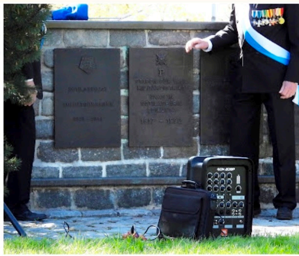
Tältä se näyttää – ja hyvin sopii rivin jatkoksi.