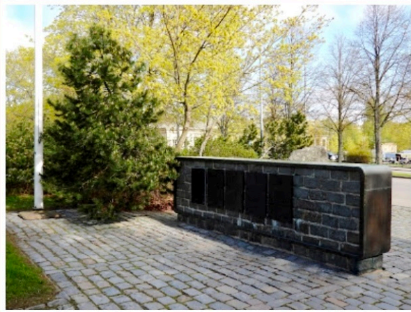
Uusin laatta, Sotilaspoika-laatta on tässä muuriosassa ensimmäisenä vasemmalta (yksi paikka vielä tyhjänä sen vasemmalla puolella).