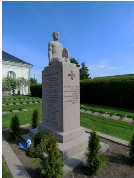
Vähänkyrön sankaripatsas ja sankarihautausmaa