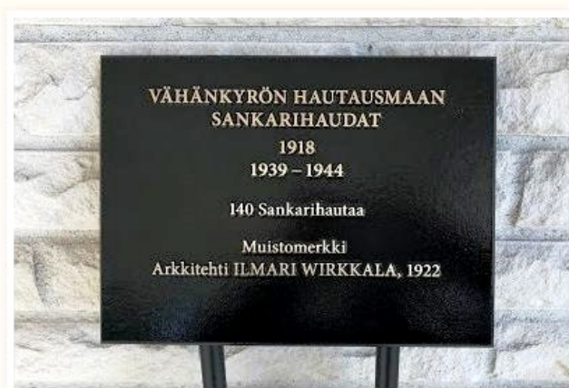
Vähänkyrön sankaripatsas, Ilmari Wirkkala, Kirkonsilta 1, Vähäkyrö

Yllä olevan blogikirjoituksen lähteenä on käytetty ILKKA VIRTASELTA saatuja kuvia ja tekstejä. Tähän loppuun laitan hänen luvullaan kaksi kirjoitusta kokonaan.