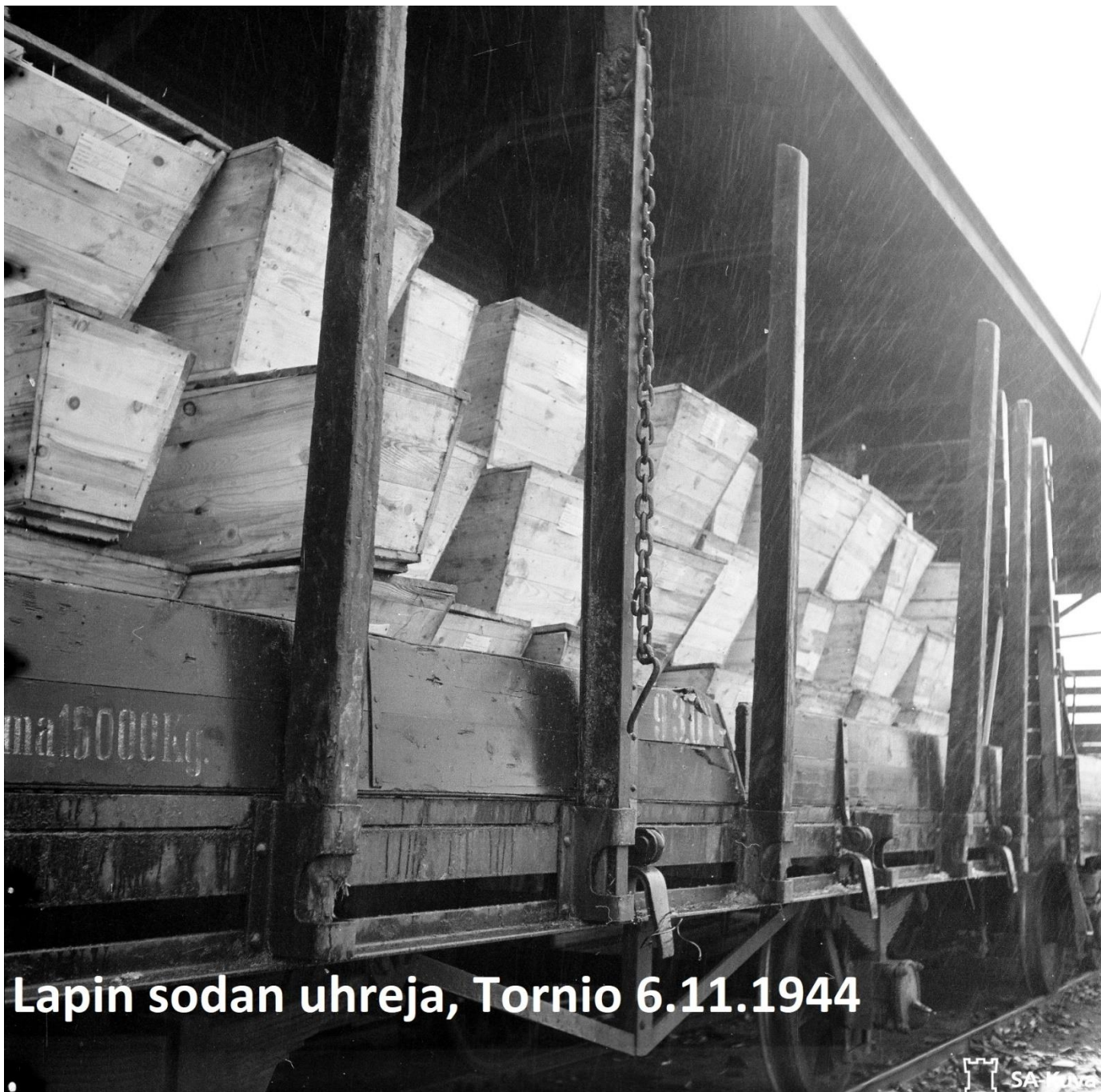
Lapin sodan uhreja, Tornio 6.11.1944