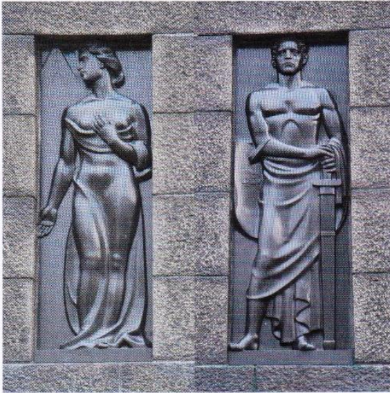
Den västra fasadens Lag- och religion – allegorier. Länthisen sivustan Laki- ja Uskonto-allegoriat.