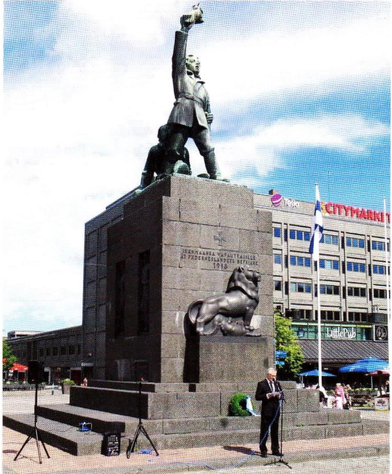
Kranspatrullen utför sin kransläggningsuppgift under ledningen av överstelöjtnant Pasi Heinua. / Aimo Nyberg kertomassa Suomen Vapaudenpatsaan sisältämästä symboliikasta

Vapaudenpatsaan paljastuksen 85-vuotismuistopäivää vietettiin sunnuntaina 9.7.2023 patsaan äärellä järjestetyssä juhlatilaisuudessa. Patsaalle laskettiin Puolustusvoimien, Vaasan kaupungin, sotiemme veteraanien ja maanpuolustusjärjestöjen yhteinen seppäle. Seppelnauhassa todettiin patsaan jalustan fasadin piirtokirjoituksen mukaisesti, tekstiä paljastuksen jälkeiset tapahtumat huomioon ottaen hieman muuntaen ”Isänmaansa vapauttajille ja saavutetun vapauden puolustajille”. Seppelienlaskua juhlistivat reserviläisistä koostuneet kaksi kunnivartiomiestä ja kolmihenkinen lippuvartio sekä veteraani- ja maanpuolustusjärjestöjen asettama lippulinna.