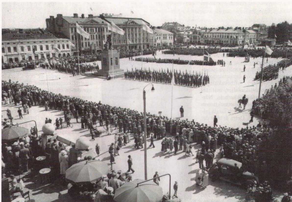
Finland har ett minnesmärke över sin frihet och självständighet. Suomi on saanut muistomerkin vapaudelleen ja itsenäisyydelleen.