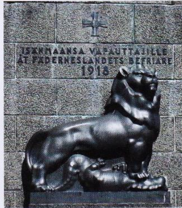
Sockelns fasad mot torget. / Patsaan jalustan torille suuntautuvaa fasadia