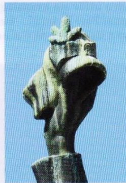
Skyddskåristernas kännetecken grankvisten som togs i bruk under Frihetskriget. / Vapaussodassa käyttöön otettu suojeluskuntalaisten kuusenhavutunnus