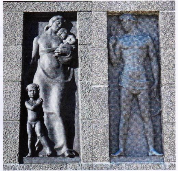
Den östra fasadens Arbete- och Framtid - allegorier. / Itäisen sivustan Työ- ja Tulevaisuus-allegoriat.