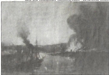
Englantilaiset tykkibarkassit tulittivat Palosaaren satamaa 8.8.1855.

Venäjän Itämeren laivastoa oli Nikolai I:n aikana vahvennettu ja englantilaiset pitivät tätä uhkana sekä syntyneille sotilaisille intresseilleen Mustanmeren alueella että merenkululle yleensä. Venäläiset oli tästä syystä suljettava Suomenlahdelle. Näin Suomi osana Venäjää joutui mukaan eurooppalaisten suurvaltakonfliktin tapahtumiin. Suomessa Oolannin sotana tunnettu Krimin sota toi rannoil-