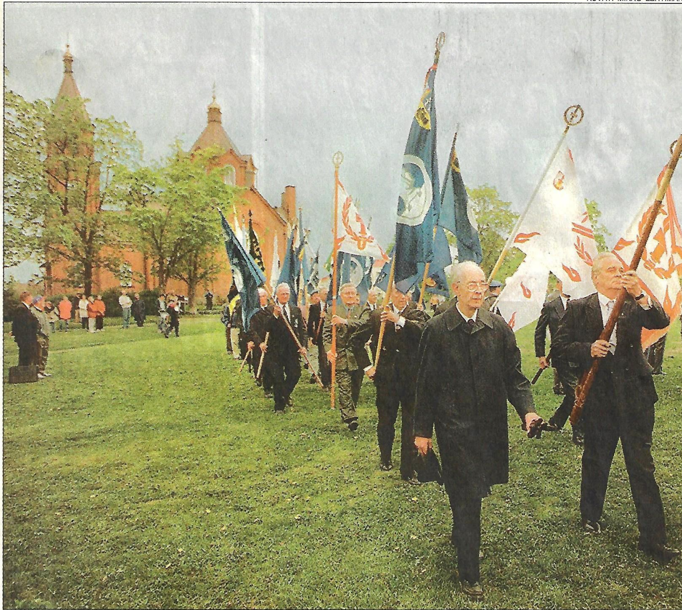
Veteraani- ja maanpuolustusjärjestöjen lippulinna juhlisti puolustusvoimien lippujuhlapäivän paraattia Vaasan kasarmintorilla.