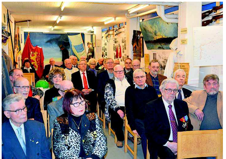
Luento sotakorvauksista kokosi kiinnostavuudellaan Vaasan Sotaveteraanimuseon tilat lähes täyteen.