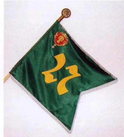
Vaasan osaston lippu naulattiin ja vihittiin Vaasan kirkossa 25.2.2006, osaston viettäessä 30 – vuotisjuhlaa.