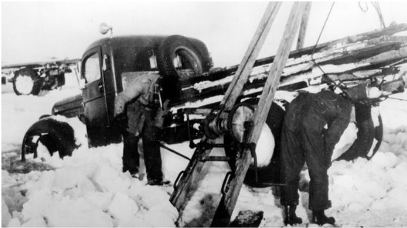
Liikennöinti jäätillä ei ollut helppoa. Jäihin vajonnutta autoa nostetaan.