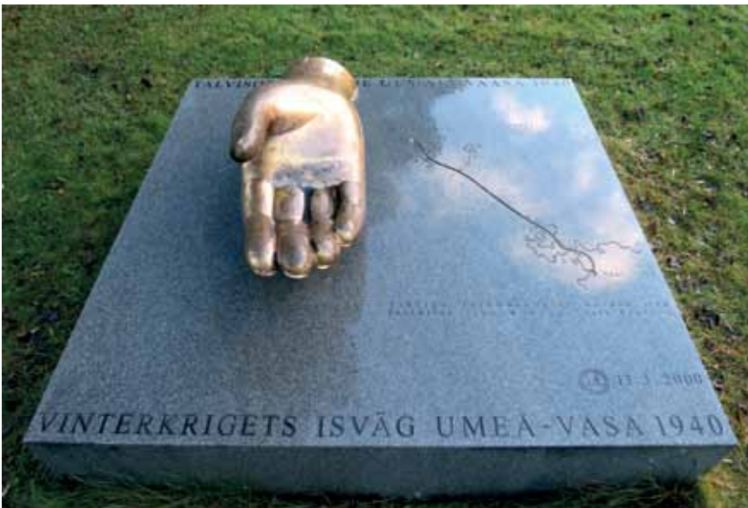
Merenkurkun jäätien muistomerkinä on Tiklas-puistossa Vaasassa kuvanveistäjä Pekka Jylhän teos Kultainen käsi.