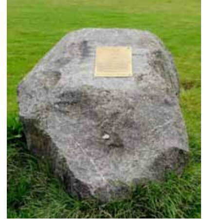
Jäätien Uumajan muistomerkki.