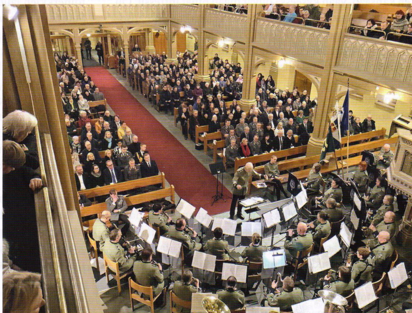
Perjantain kirkkokonsertissa saivat MPK:n Pohjanmaan soittokunta ja Pohjois-Suomen reserviläiskuoro esiintyä täydelle salille.