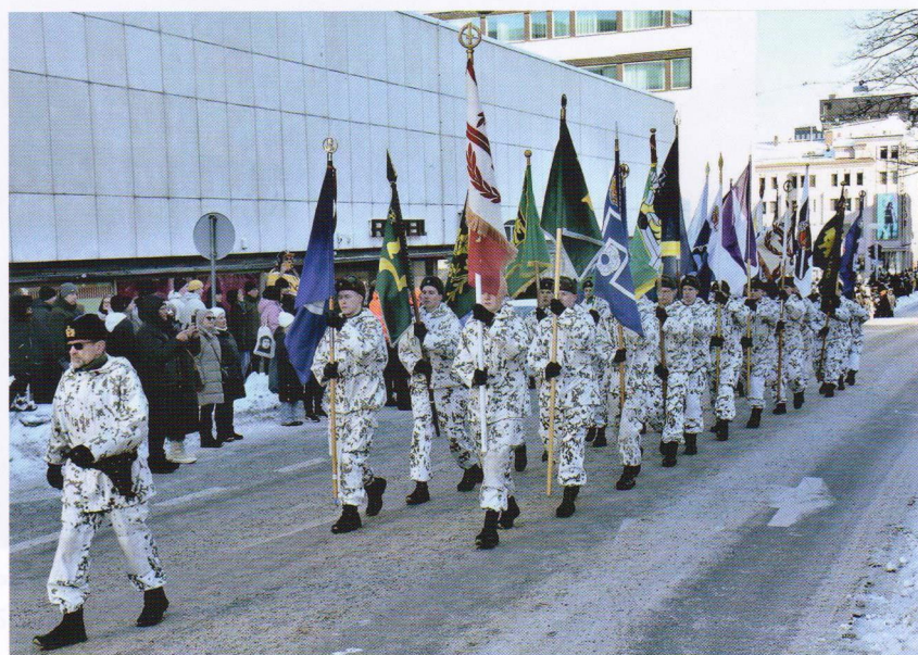
Reserviläisten lippulinna paraatissa.