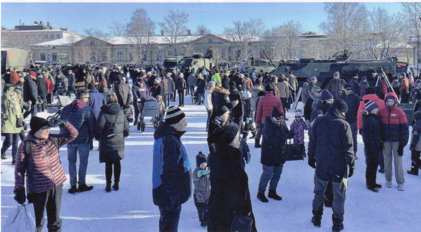
Porin prikaatin syömähampaat kalustonäyttelyssä vanhalla kasarmialueelle olivat houkutelleet runsaasti väkeä paikalle.