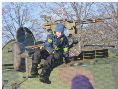
Tuleva jääkäri tutustuu miehistöpanssari Pasiin ja sen raskaaseen konekivääriin.

Viralliseen ja yleisölle avoimeen ohjelmaan kuuluivat vielä seppeleenlaskut Jääkäripatsaalle, minne oli koontunut myös iso joukko ihmisiä, ja seppeleitä tuotiin paikalle useita. Seppeleiden laskijatahoina olivat Puolustusvoimat (Puolustusvoimien komentaja kenraali Timo Kivinen ja