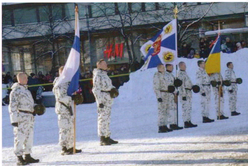
Liput paraatikentällä: Valtakunnan lippu, Jääkärilippu sekä Porin prikaatin lippu.