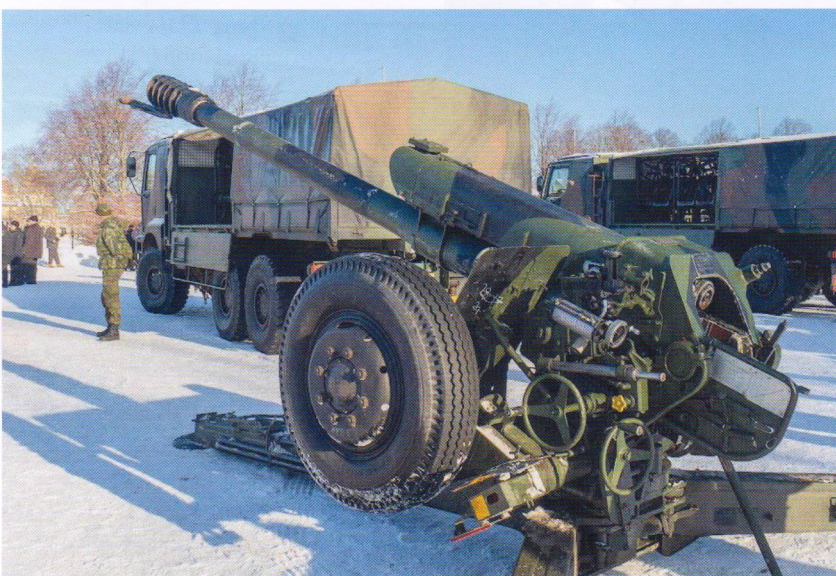
Kenttähaupitsi 122 H 63 on Puolustusvoimissa laajasti käytetty tykki.

Lauantaiaamu alkoi kalustonäyttelyllä Kasarminkentällä. Näyttelyssä oli esillä Porin prikaatin suorituskykyisintä kalustoa, lähinnä jääkäriyksiköille tärkeitä modernein, osin raskainkin aseiri varustettuja ajoneuvoja. Maanpuolustusjärjestöt esittelivät toimintaansa kalustonäyttelyn yhteydessä.