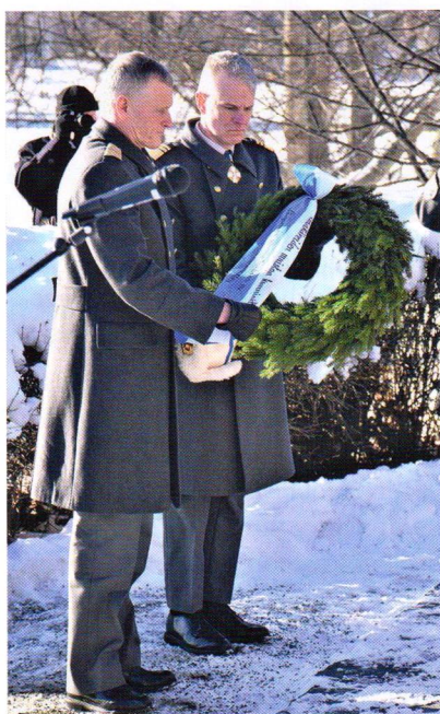
Puolustusvoimien komentaja kenraali Timo Kivinen ja kenraaliluutnantti Pasi Välimäki laskivat Puolustusvoimien seppeleen Jääkäripatsaalle.