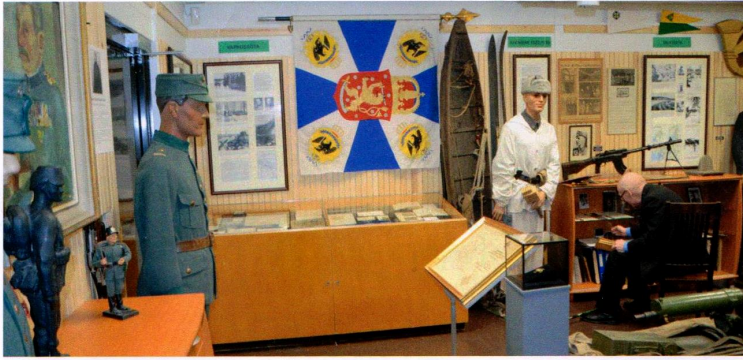
Hämeen Panssaripataljoonan perinnehuoneessa on runsaasti JP 27:n historiaan liittyviä esineitä. Siellä säilytetään myös jääkärilippua.

hin. Testamenttien toivotaan löytävän arvoisensa paikan kaikista Suomen sotilaskodeista.