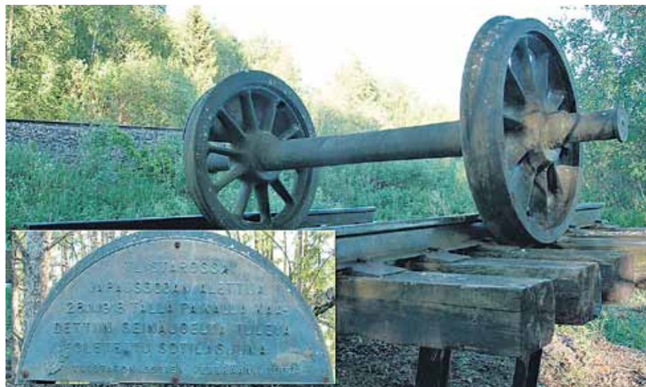
Junan kaadon muistomerkki Ylistaron Peränevalla.