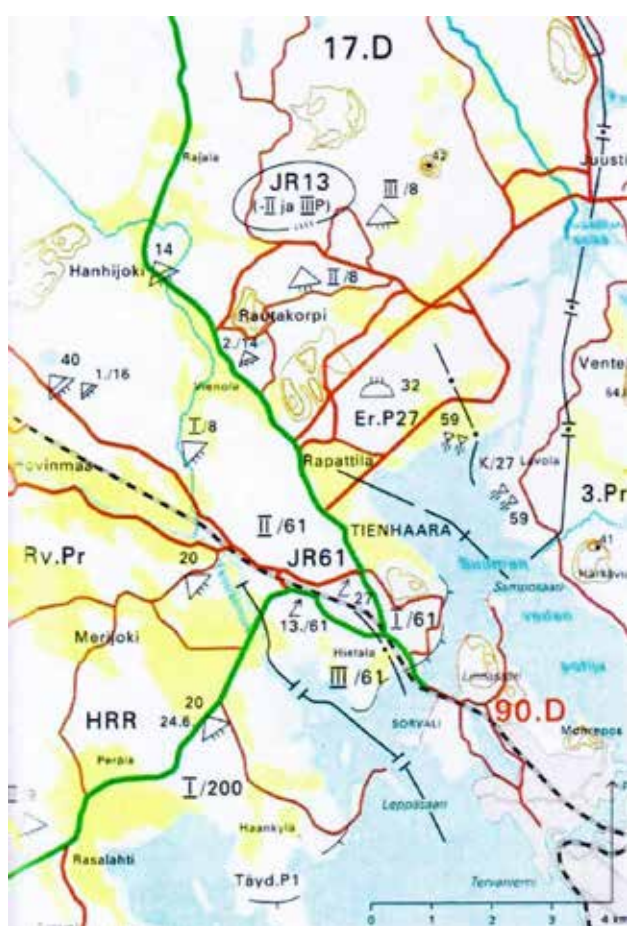
17. Divisioonan asemat Kannaksella 23.6.1944