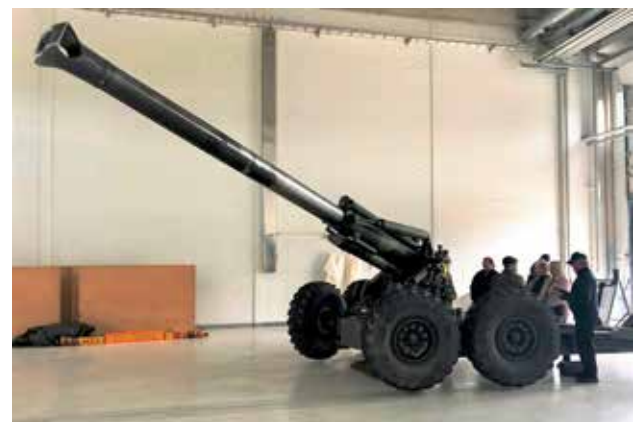
Raskas kanuuna 155 K 83–97, valmistaja Vammassuomi, kaliiberi 155 mm, kantama 29 km, 6 laukausta/min, paino 10,5 tn, ammuksen paino 43 kg.