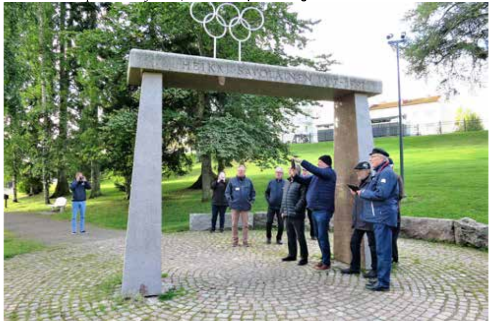
Olympiamitalisti Heikki Savolaisen muistomerkki (Matti Koskela 2007)