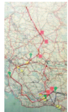
Erään kaukopartiomatkan havainnollistus