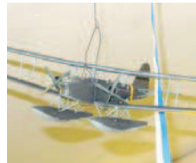
Kaukopartiomiesten kuljetuksiin käytetyt Heinkel HE 50 C 2:n pienoismalli.