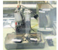
Kyynelradio mallia M4/75/7 (sisältää lähettimen ja vastaanottimen)