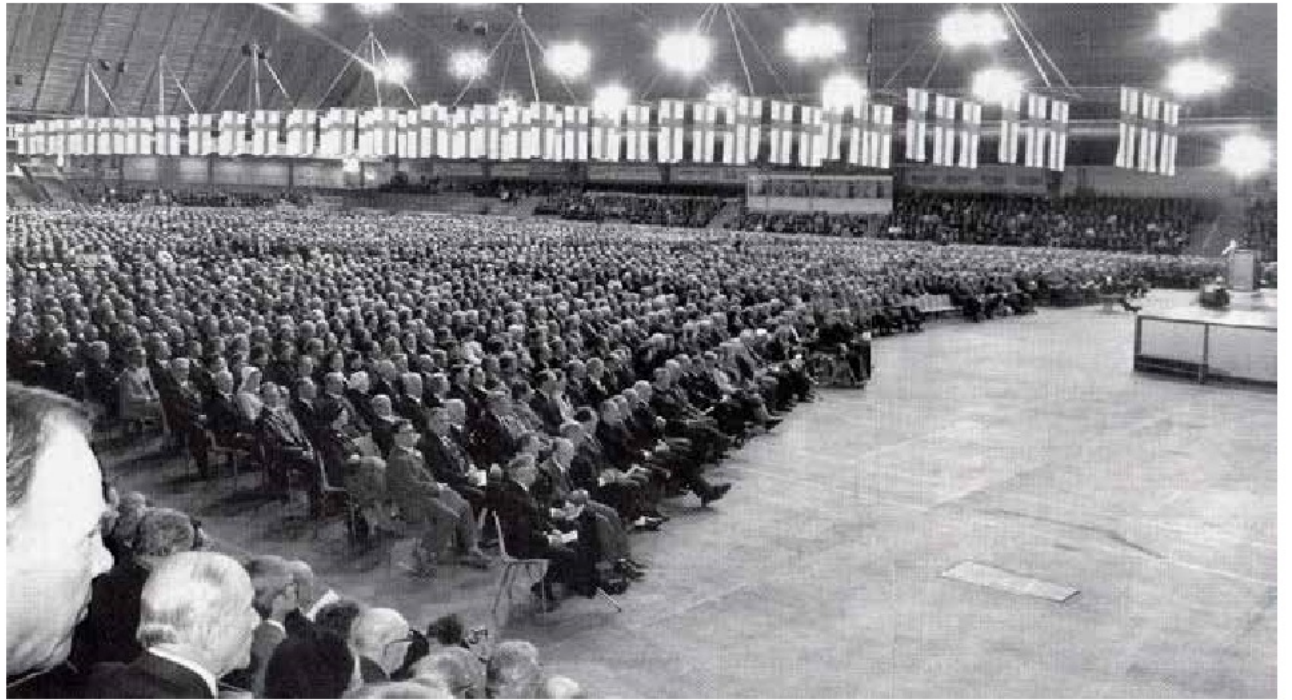
Ensimmäinen veteraanijuhla oli osa itsenäisen Suomen 70-vuotisjuhla. Lahden pääjuhlassa seitsemälläkymmenellä Suomen lipulla koristeltu suurhalli täyttyi noin 10000 veteraanista.