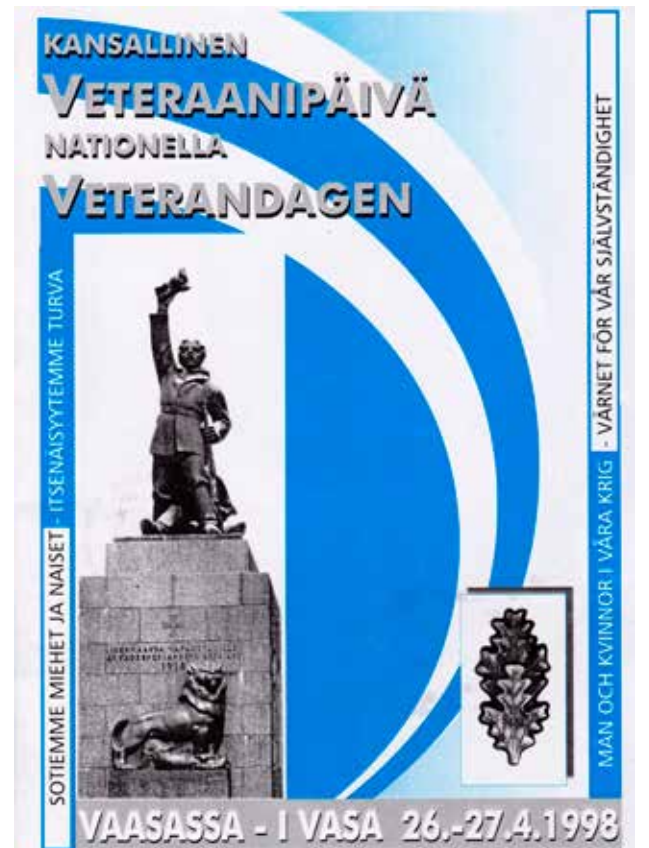
Sotaveteraaneille rakas Suomen Vapaudenpatsas oli luonnollinen valinta Vaasassa vuonna 1998 järjestetyn Kansallisen veteraanipäivän pääjuhlan ohjelman kansikuvaksi.