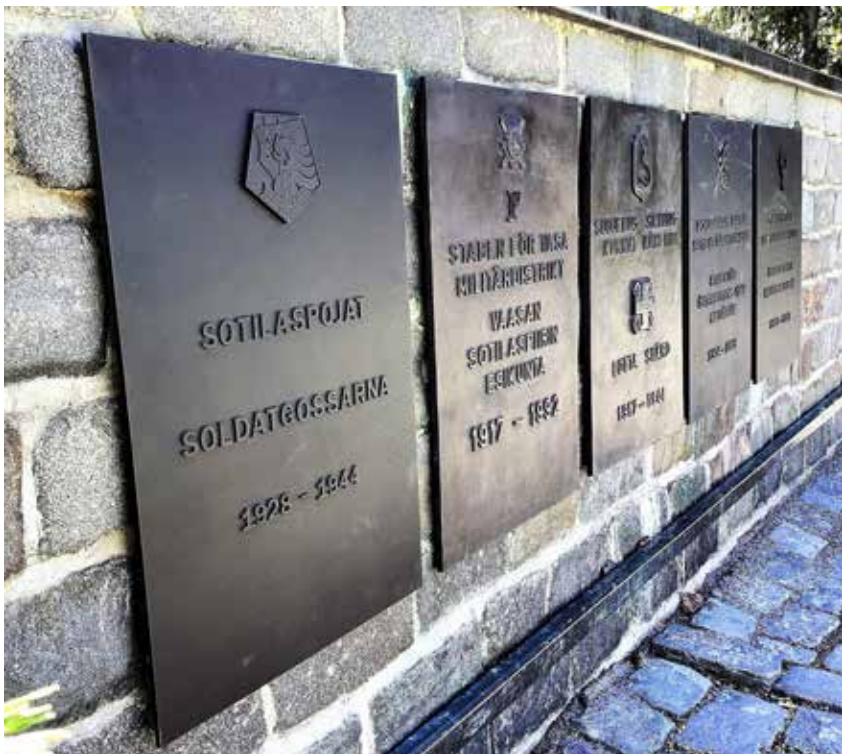
Sotilaspoikien muistolaatta uusin tulokas Vaasan Kasarmintorin Perinnemuurin 27 muistolaatan joukossa.