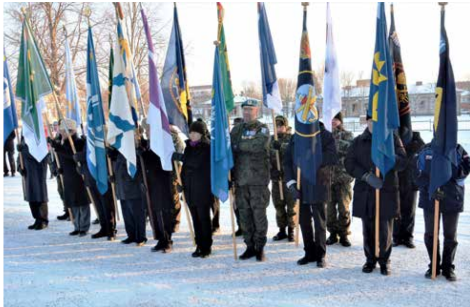
Veteraani- ja maanpuolustusjärjestöjen lippulinna maanpuolustustyölle omistetussa Tamminuntain seppeleenlaskutilaisuudessa Vaasan Kasarmintorin Perinnemuurilla

Venäjän arvaamaton ja ennakoimaton käyttäytyminen Ukrainaan ja erityisesti sen siviiliväestöön kohdistuvissa raaoissa sotatoimissa näkyy myös Suomessa mm. kasvaneena kiinnostuksena vapaaehtoista maanpuolustustyötä kohtaan ja lisääntyneenä osallistumisvalmiutena siihen. Mahdollisuudet osallistua ovatkin monipuoliset ja sopivia toimintamuotoja löytyy kaikille, yhtä hyvin naisille kuin miehille. Tehdävääkö löytyy vahvasti sotilaalliseen maanpuo-