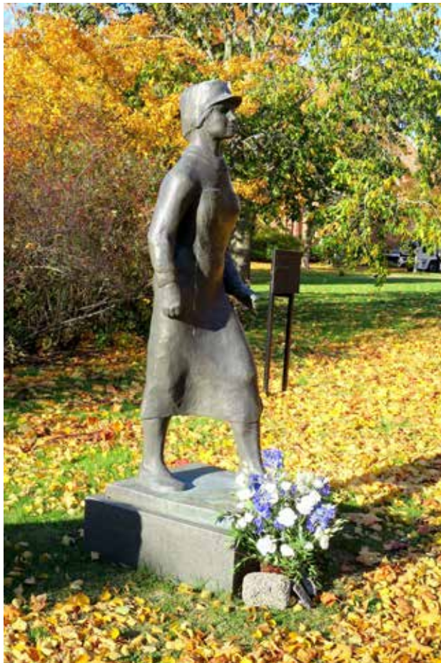
Ruskan keskellä Vaasan Kasarmintorin Perinnemuurin tuntumassa asteleva Tea Helenelund-Suomisen Lotta-patsas (2005) on saanut Lottaperinnettä ry:n sinivalkoisen kukkalaitteen juurelleen

Lottajärjestö lakkautettiin muiden suojeluskuntajärjestöjen tapaan Moskovan välirauhansopimuksen perusteella marraskuussa 1944. Järjestön huomattava omaisuus onnistuttiin kuitenkin pelastamaan tarkoitusta varten perustetulle Suomen Naisten Huoltosäätiölle. Säätiö kerrytti varallisuuttaan muilla lahjoituksilla ja perustamalla yritystoimintaa sodasta palanneiden lottien työllistämiseksi. Säätiö jatkoi myös muuta aiemman Lottajärjestön toteuttamaa huolto- ja avustustoimintaa. Vuonna 2004 Suomen Naisten Huoltosäätiö vaihtoi nimekseen Lotta Svärd Säätiö. Säätiö tukee nykyisin myös vapaaehtoista maanpuolustustyötä ja tekee omaa perinnetyötä ylläpitämällä Tuusulan Syvärannan Lottamuseota. Entiset lotat alkoivat jo 1950-luvulla kerätä muistitietoa ja muuta aineistoa järjestönsä toiminnasta. Toiminta tapahtui julkisuudelta piilossa. Lottien perinnetyön näyttävä avaus tapahtui 13.9.1991 Finlandia-talossa järjestetyssä Lottajärjestön perustamisen 70-vuotisjuhlassa, jonka järjestelyistä vastasi Suomen Maanpuolustushistoriallinen yhdistys. Valtiojohto ja Puolustusvoimat tukivat juhlaa avoimesti osallistumalla sekä juhlan suunnittelutyöhön että itse juhlaan. Lottien oma perinnetyö käynnistyi tämän jälkeen ripeästi. Suomen Rintamanaisten tuella pe-