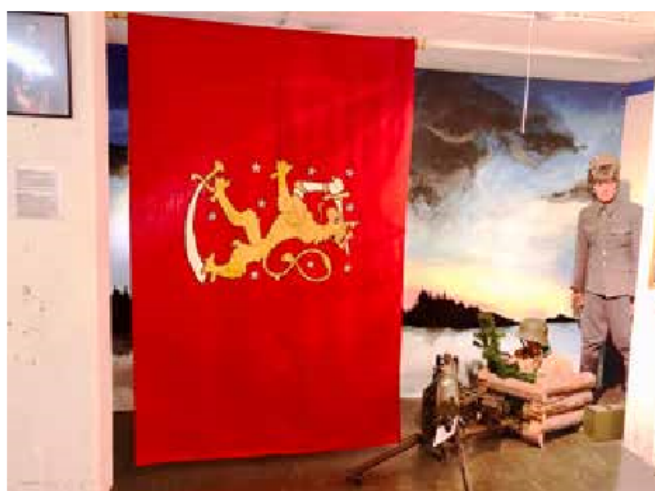
Leijonalippu museon Vapaussota-osastossa väljempiin tiloihin ripustettuna.