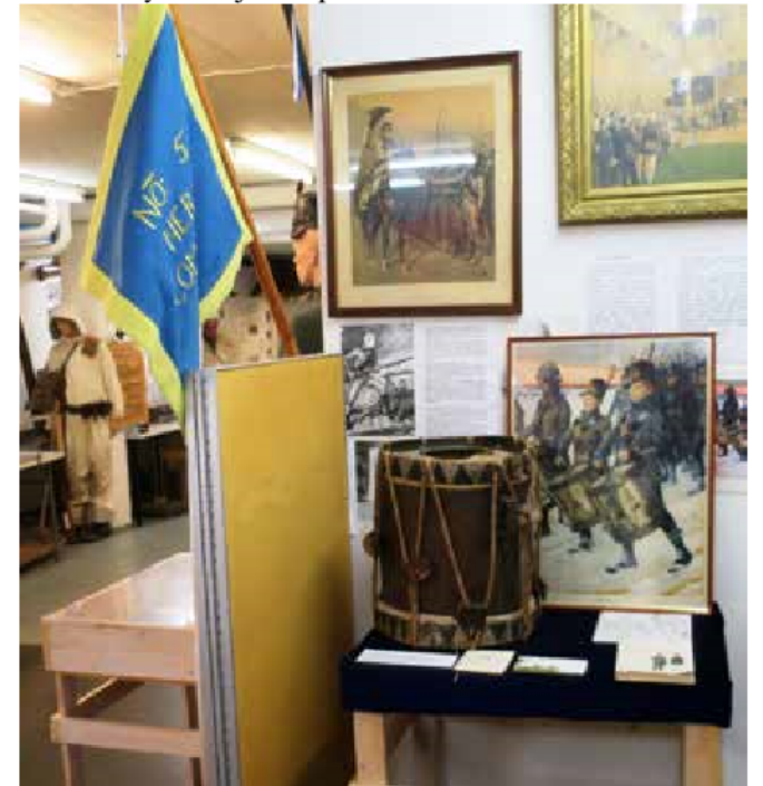
Museon näyttelyn kertomus Suomen tiestä kohti itsenäisyyttä sekä taisteluista itsenäisyyden saavuttamiseksi ja saavutetun itsenäisyyden turvaamiseksi alkaa Suomen sodasta 1808–1809, jota edustavat sotaan osallistuneelle Pohjanmaan Rykmentin Närpiön komppanialle kuuluneet lippu ja sotilasrumpu.