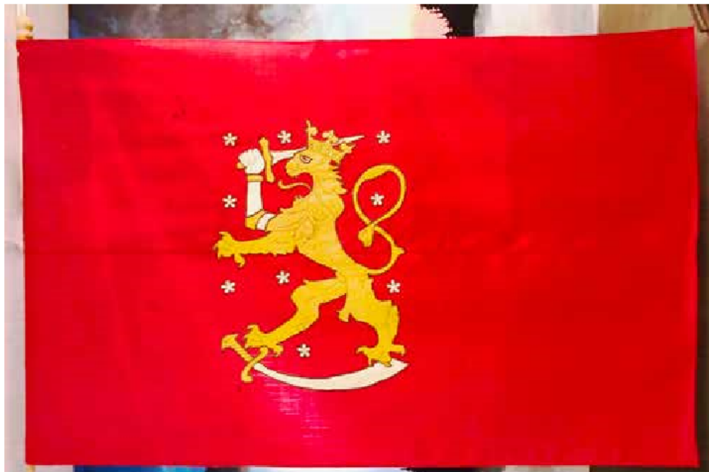
Suomen valtiolipuksi vuoden 1918 sankarihautajaisia varten valmistettu Leijonalippu huolellisen konservoinnin jälkeen.

Vaasan Sotaveteraanimuseon arvoa korostaa se, että museon perusaineisto on veteraanien itsensä 1980- ja 1990-luvuilla keräämää. He myös osallistuivat aktiivisesti museon perustamiseen ja sen alkuvuosien toimintaan sekä valitsivat Pohjanmaan Maanpuolustuskillan museon toiminnan pysyväksi toteut-