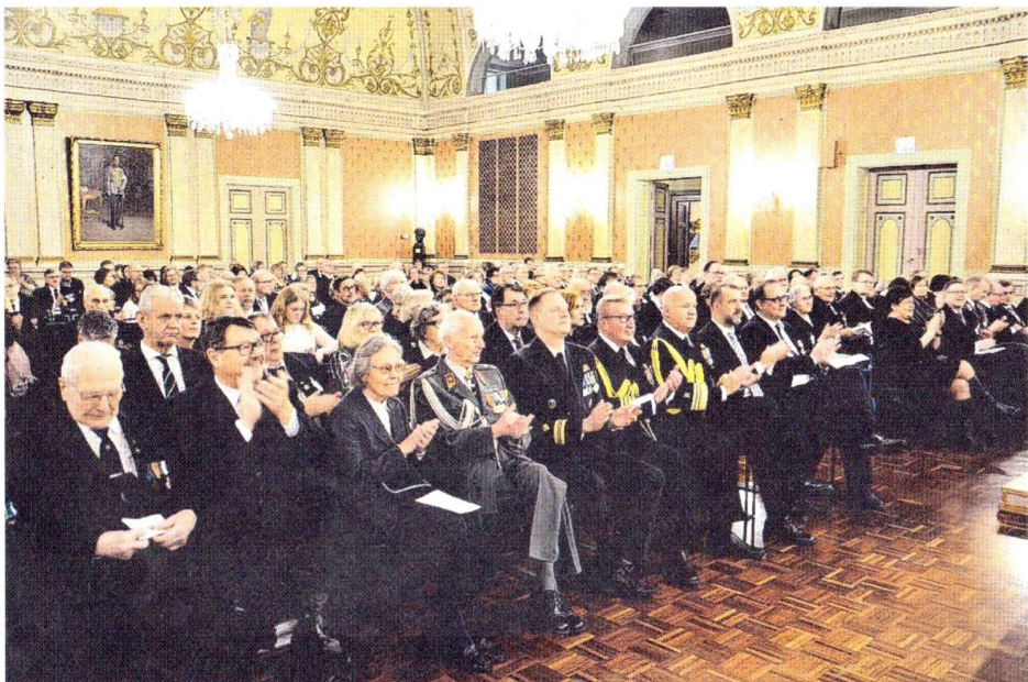
Arkkipiispa Paarma sai Kaupungintalon juhlasalin täyttymään ääriään myöten juhlayleisöstä.

Österbottens Försvarsgille – Pohjanmaan Maanpuolustuskilta