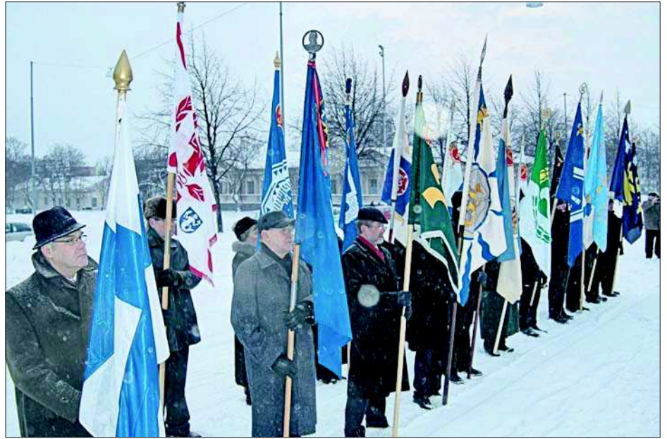
Päivän juhlallisuuat aloitettiin havuseppeleen laskemisella Perinnemuurilla, johon osallistui myös 20 vaasalaisen maanpuolustusjärjestön lippulinna.