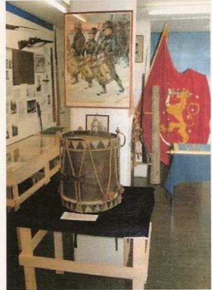
Suomen sodan aikainen ”porilaisten marssi”-rumpu ja vapaussodan aikainen Leijonailippu, jonka kaksi kaskislaisneitiä ompeli vuonna 1918 vapausoturin hautajaisia varten.

Näyttely alkaa 1808 keisari Aleksanterin julistuksesta. Autonomian ajasta siirrytään jääkäriliikkeen ja vapausotdan vaiheisiin. Suojeluskunta- ja lottaineistoa on runsaasti. Talvi- ja jatko-