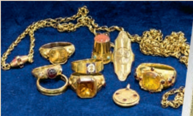
■ Kultakeräyksen komeimpia esineitä Hämeenlinnan Skogster-museon näyttelyssä vuonna 2019.

esimerkkiä veteraanien perintöön sisältyvän yhteisöllisyyden tuomista nykynuorten tietoisuuteen Puolustusvoimien rautasormuskunnia-palkinnon muodossa. Kirjoituksessa on kuvattu myös toteutettua kultakeräyshanketta. Siksi on lopuksi hyvä tarkastella lyhyesti myös keräyksen myöhempiä vaiheita.