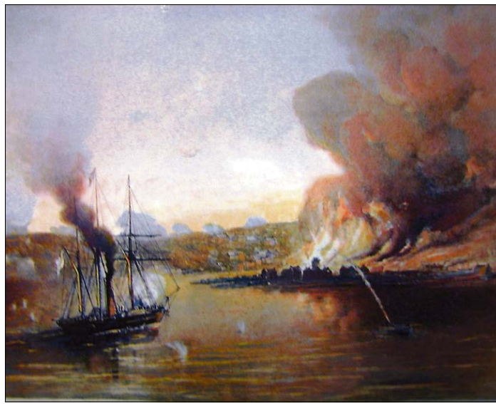
C. Cramer: Englantilaiset tykkibarkassit tulittavat Palosaaren satamaa 8.8.1855. Väri litografia.

Virtanen toivoo, että salmeen rantaan saataisiin joskus näistä Oolannin sodan tapahtumista kertova muistolaatta tai muistomerkki.