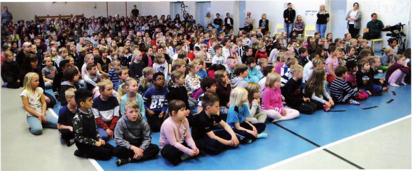
Huutoniemen koulun oppilaat järjestäytyneenä seuraamaan veteraanitapahtuman ohjelmaa.