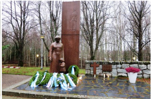
Sepeleitä kertyi muistomerkillä tänä vuonna poikkeuksellisen paljon

Kello 12 laskettiin kukkalaite Jääkäripatsaalle. Tapahtuman toteutuksesta vastasi JP 27 Perinneyhdistyksen Vaasan osasto.