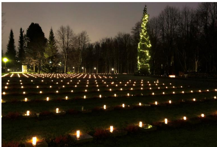
Kynttilät sytyivät Vaasan sankarihautoilla klo 8 aamulla

Itsenäisyyspäivän tilaisuudet Vaasassa alkoivat perinteisellä kynttilöiden sytytyksellä Vaasan vanhan hautausmaan sankarihautoilla klo 8. Kaikki 440 sankarihautaa, 381 sotien 1939–1944 hautaa ja 59 Vapaussodan 1918 hautaa, saivat elävän kynttilän muistolaattansa viereen. Tapahtuman toteutuksesta vastasivat Vaasan Rintama- ja Sotaveteraanit – Vasa Front- och Krigsveteraner yhdessä senioripartiolaisten kanssa.