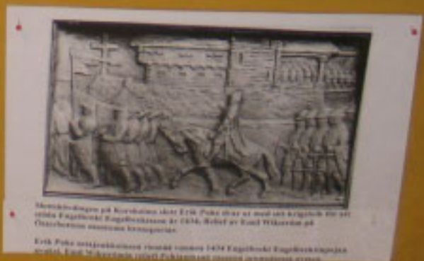
Steinrelieffet på Kyrkväggarna i Åre. Bilden visar en med sin betydelse för att dena kyrkans byggnadsåren är 1816. Bilden är utförd av Carl Willehelms på Christiansborgs museum i Kristiania. Erik Pöhl och familjen som bodde i Åre 1474. Bilden är utförd av Carl Willehelms på Christiansborgs museum i Kristiania.